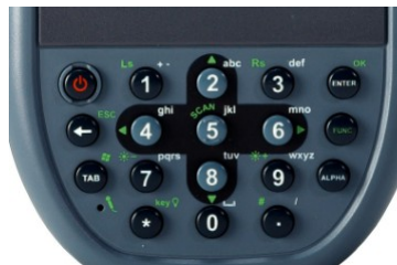
PA600 Standard (従来品)