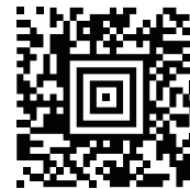
&lt;STX&gt;[ データ ]&lt;ETX&gt;