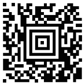
[ データ ]&lt;CR&gt;&lt;LF&gt;

バーコード読み取り後にスキャナが付加する接頭辞と接尾辞を設定することができます。標準は「[ データ ]<CR><LF>」です。その他についてはユーザーマニュアルの「プリフィックス / サフィックス」の項目をご覧ください。