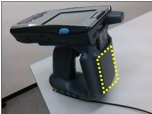
黄色いエリアがアンテナです